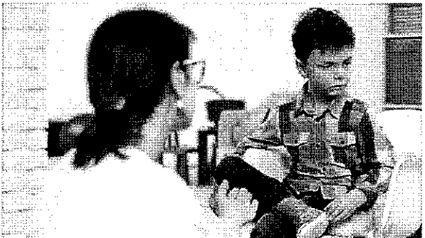
מספר האבחונים ממשיך לזנק. ADHD

וכך, ככל שהמחלה הפכה למומחגת ומוכרת יותר - הלך ועלה מספר הילדים ובני הנוער המאובחנים עם ADHD ובקשר ישיר עלה מספר המרשמים לריטלין. בישראל, עוד לפני הזינוק הזה, מספר הילדים המאובחנים כבעלי הפרעת קשב וריכוז הוכפל מאז 2005 (6.8% מהילדים) ועד 2014 (14.4%).